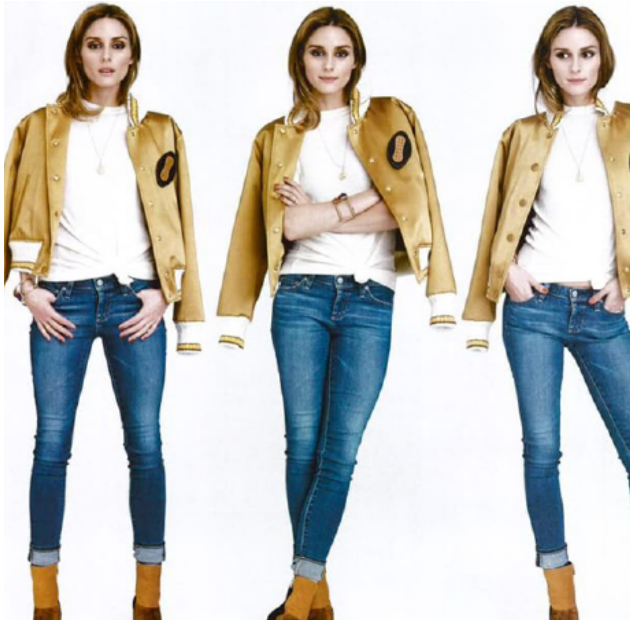
REGRA DE ESTILO: A TERCEIRA PEÇA